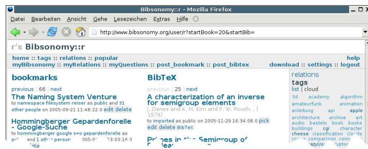
Abbildung 2. Bibsonomy zeigt gleichzeitig Bookmarks und (BIB T E X -basierte) bibliographische Referenzen an.

man für einen gegebenen Benutzer alle ins System eingestellten Ressourcen sowie die vom Benutzer zugewiesenen Tags einsehen (siehe Abb. 2). Klickt man auf eine Ressource, so sieht man alle anderen Benutzer des Systems, die diese Ressource ebenfalls ins System eingestellt haben, sowie deren Tags. Klickt man auf ein Tag, so erhält man alle Ressourcen, die ein solches Tag bekommen haben.